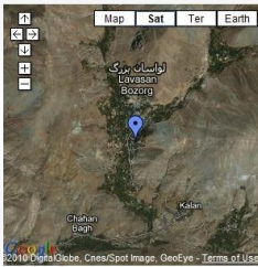
View Lavasanat in a larger map