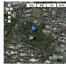
View Khamseni's Niyvaran Palace in a larger map