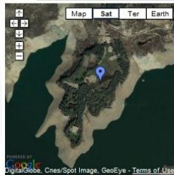
View Latyan Dam Palace in a larger map