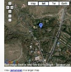
View in a larger map