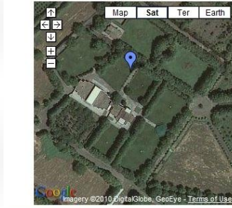
View Malek Abad - Mashhad in a larger map